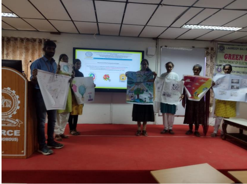
Poster and PPT presentation competition on Energy Conservation Awareness on 23 rd January, 2023